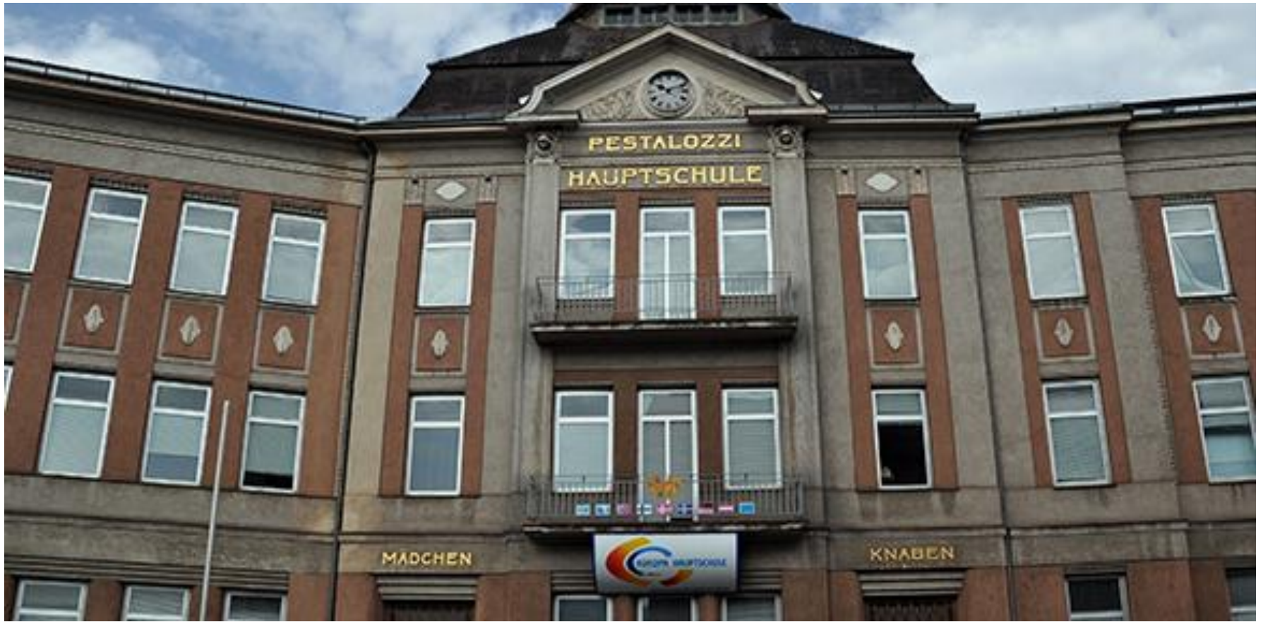
Pestalozzi Schule, Leoben