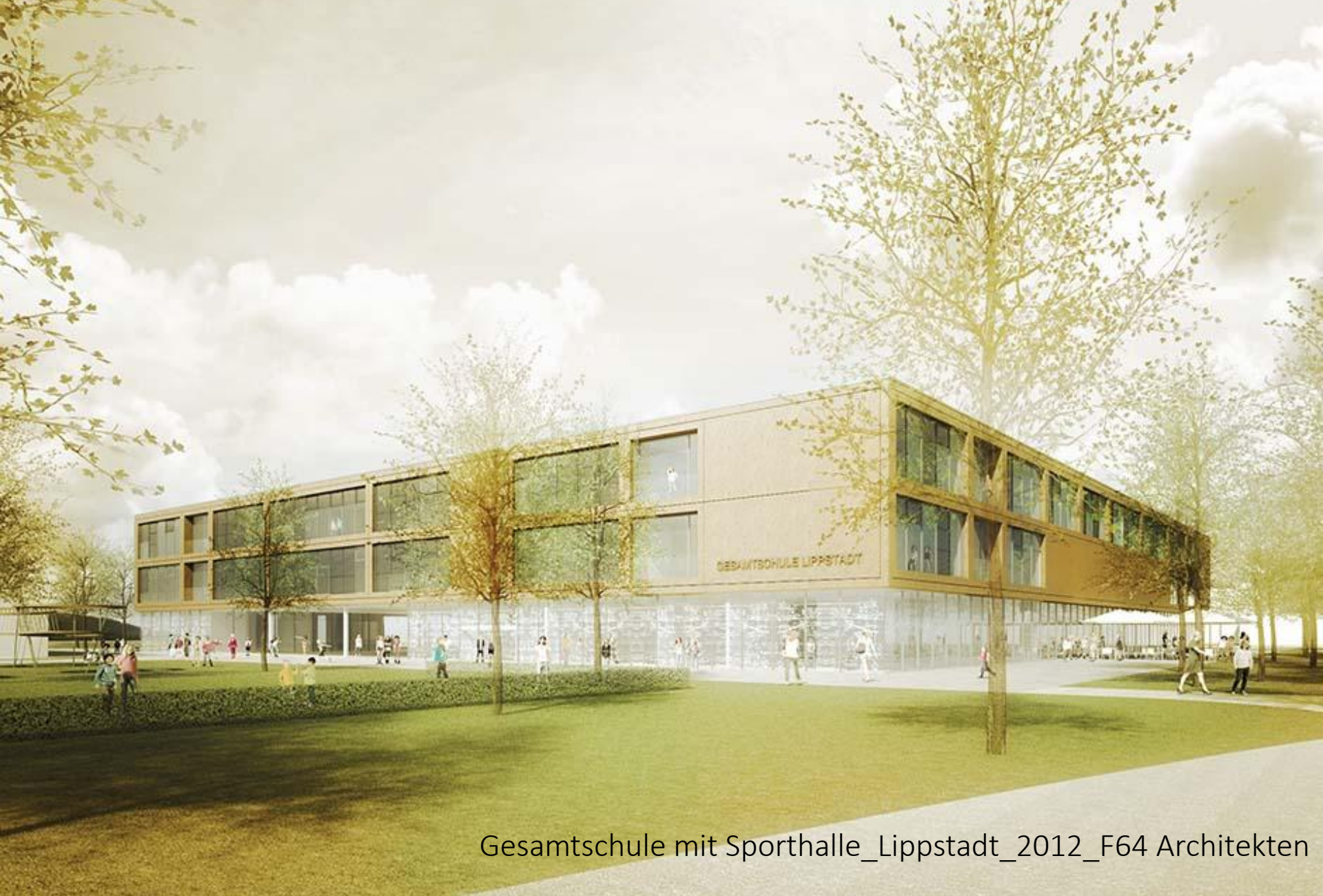
Gesamtschule mit Sporthalle_Lippstadt_2012_F64 Architekten